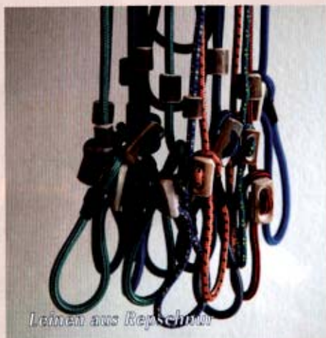
Leinen aus Reppschon

die Wahl von Farbe und Material. Auf den gefragten Neoprenhalsbändern kann der Name des Hundes und die Telefonnummer des Halters aufgestickt werden.