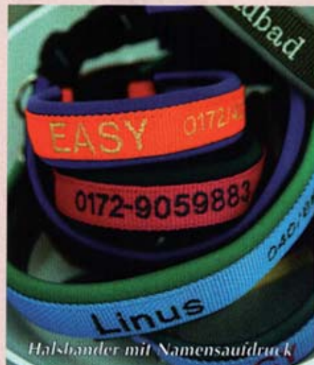
Halsbänder mit Namensaufdruck

Praktisch, schön, ungewöhnlich und von hoher Qualität werden Halsbänder und Leinen von individuellen Herstellern aus aller Welt präsentiert. Die Linie „Ribbon“ aus Kanada besticht durch