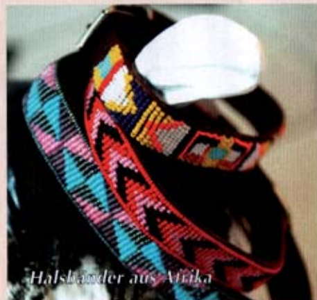
Halsbänder aus Afrika

die Wahl von Farbe und Material. Auf den gefragten Neoprenhalsbändern kann der Name des Hundes und die Telefonnummer des Halters aufgestickt werden.