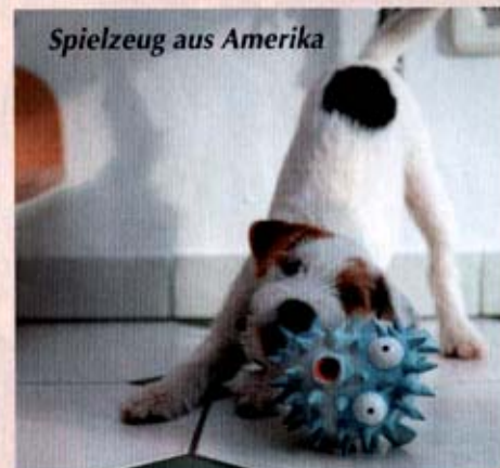
Spielzeug aus Amerika

in dem „PJRT-Club of Germany e.V.“. Auf Sonderanfertigungen haben sie sich spezialisiert. Sie erfüllen jeden Wunsch, solange es den Hund nicht stört, einschränkt oder übermäßig schmückt. Und wieder läuft ein Lächeln über ihr Gesicht und sie erzählen von einer Kundin, die heiraten und einen Smoking für ihren Vierbeiner bestellen wollte. Okay, alles hat seine Grenzen, auch der